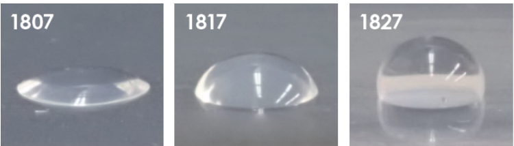
水接触角测试 (2 \mu L、1秒后)